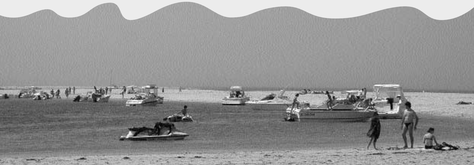
Jour de faible affluence estivale sur la Réserve Naturelle du Banc d'Arguin