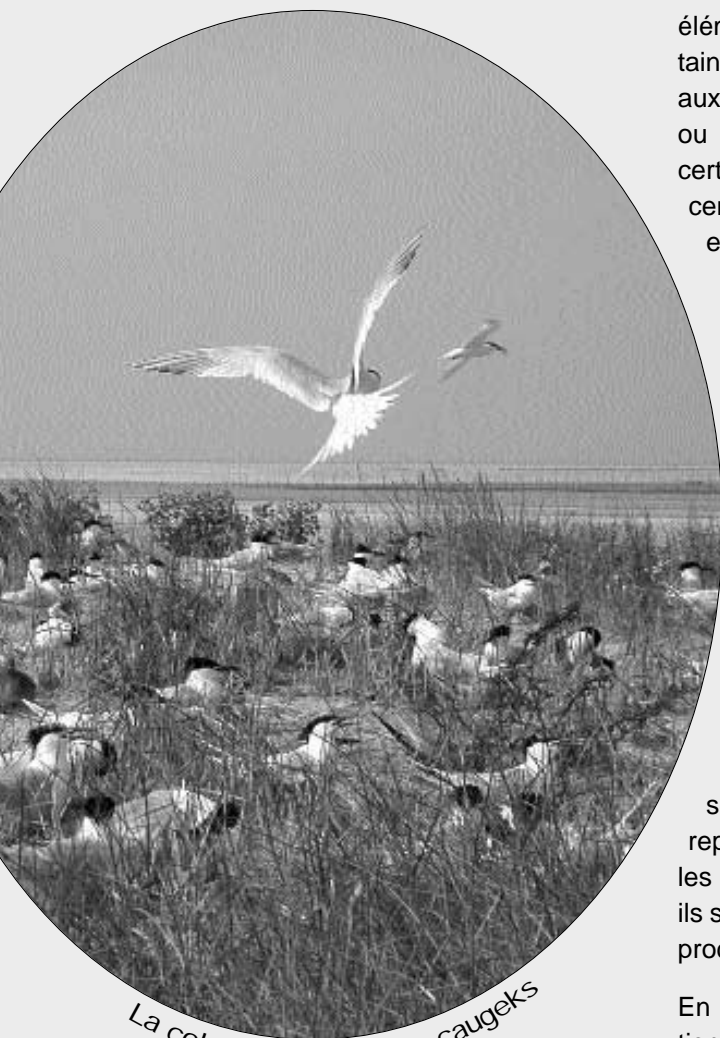
La colonie de Sternes caugeks

zone de nidification d'accès strictement interdit délimitée tous les ans. Tant qu'il y aura suffisamment de place et un stock de poissons conséquent à proximité de la Réserve, les Sternes semblent avoir encore de beaux jours devant elles.