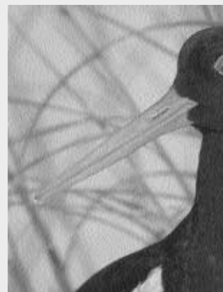
De haut en bas : Bécasseaux, Courlis cendrés, Huîtrier pie