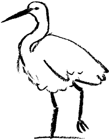
Aigrette garzette (dessin : Laurent Rousserie)

Pour obtenir un croquis authentique, il faut un matériel simple : un car-