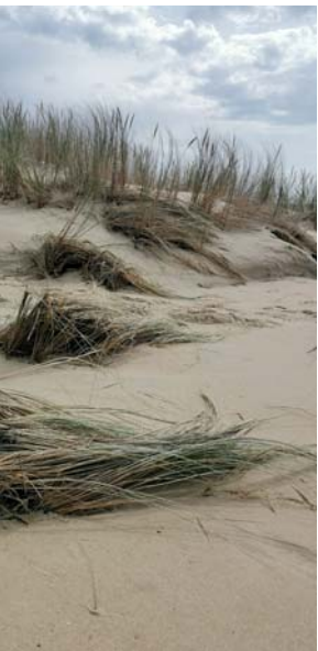
Plants d'oyats ayant subi la marée

espacent leurs nids de plusieurs dizaines voire centaines de mètres les uns des autres. La réduction des surfaces émergées devrait donc s'accompagner d'une baisse de leur effectif. Les gravelots auront toutefois la capacité de se reporter sur les plages océanes du Cap Ferret et de La Teste-de-Buch où des congénères sont déjà présents. Mais les Huîtriers pies, plus farouches, affectionnent particulièrement les zones littorales sans fréquentation humaine. La Réserve Naturelle Nationale du Banc d'Arguin étant son seul site de reproduction régulier en Nouvelle-Aquitaine, une baisse des effectifs sera d'autant plus préjudiciable au niveau régional. ■