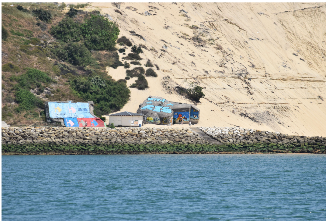
Amer cité à l'article 1 – limite nord Blockhaus au pied du lieu dit "La Corniche"