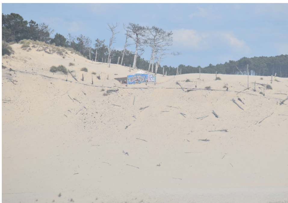
Amer cité à l'article 1 – limite sud Maison sur la Dune